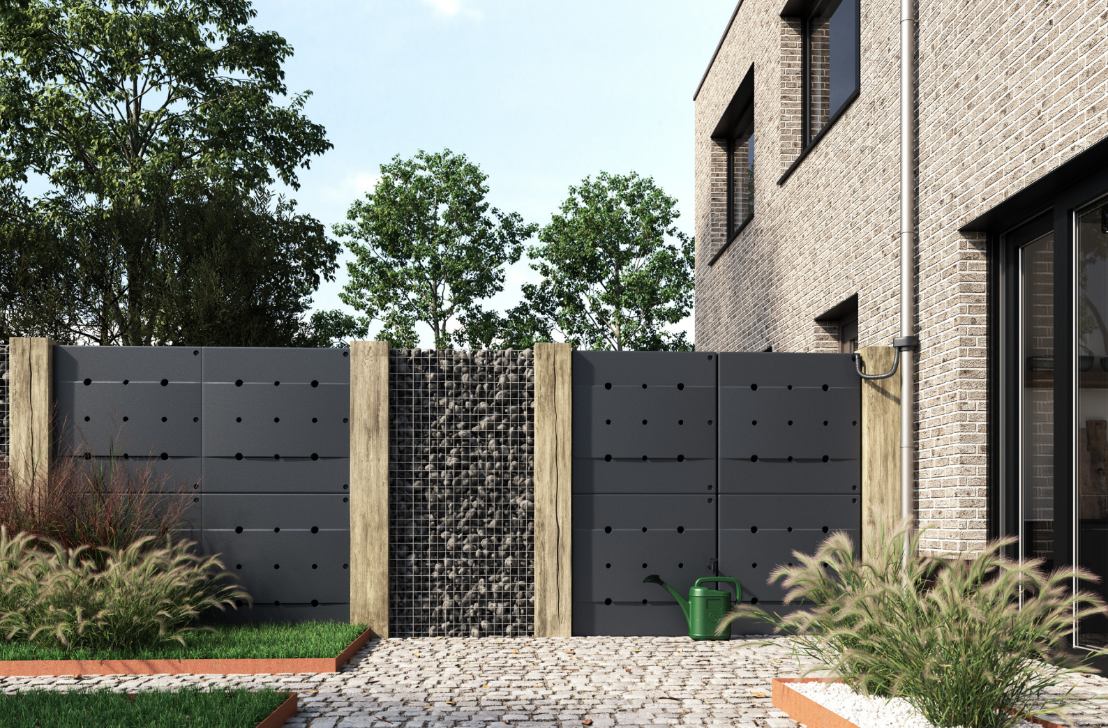
De Rainblock geplaatst als tuinafscheiding.