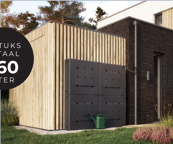
Kleur: Zwart, geplaatst als muuropstelling

We love Rain. Dat klinkt misschien vreemd, maar toch is het zo. Door het veranderende klimaat zullen we steeds verantwoordelijker om moeten gaan met drinkwater. Overheid en gemeenten sturen steeds meer aan op opslag van regenwater voor gebruik op momenten dat je het water wel nodig hebt. Met het innovatieve Rainblock®-systeem kun je op een efficiënte en mooie manier regenwater opslaan. Dankzij het compacte ontwerp kan de Rainblock® verwerkt worden in een tuinafscheiding of muuropstelling. Het modulaire systeem kan worden uitgebreid met infiltratiekratten of bijvoorbeeld een bewateringssysteem.